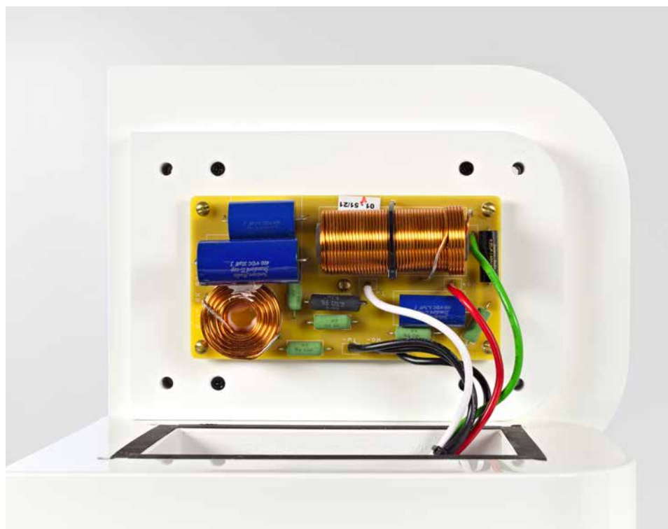
Zwei Wege = wenige Filterbausteine = besserer Klang? In der Theorie ja, mit der Praxis ist's aber so eine Sache. Bei Aperturas Sympathieträger Sensa geht die Rechnung jedenfalls auf. Die Frequenzweiche sitzt gut zugänglich auf der Bodenplatte des handlichen Standlautsprechers und kommt mit 12 Bauteilen aus. Falls Sie uns nicht glauben, zählen Sie bitte selber nach ...