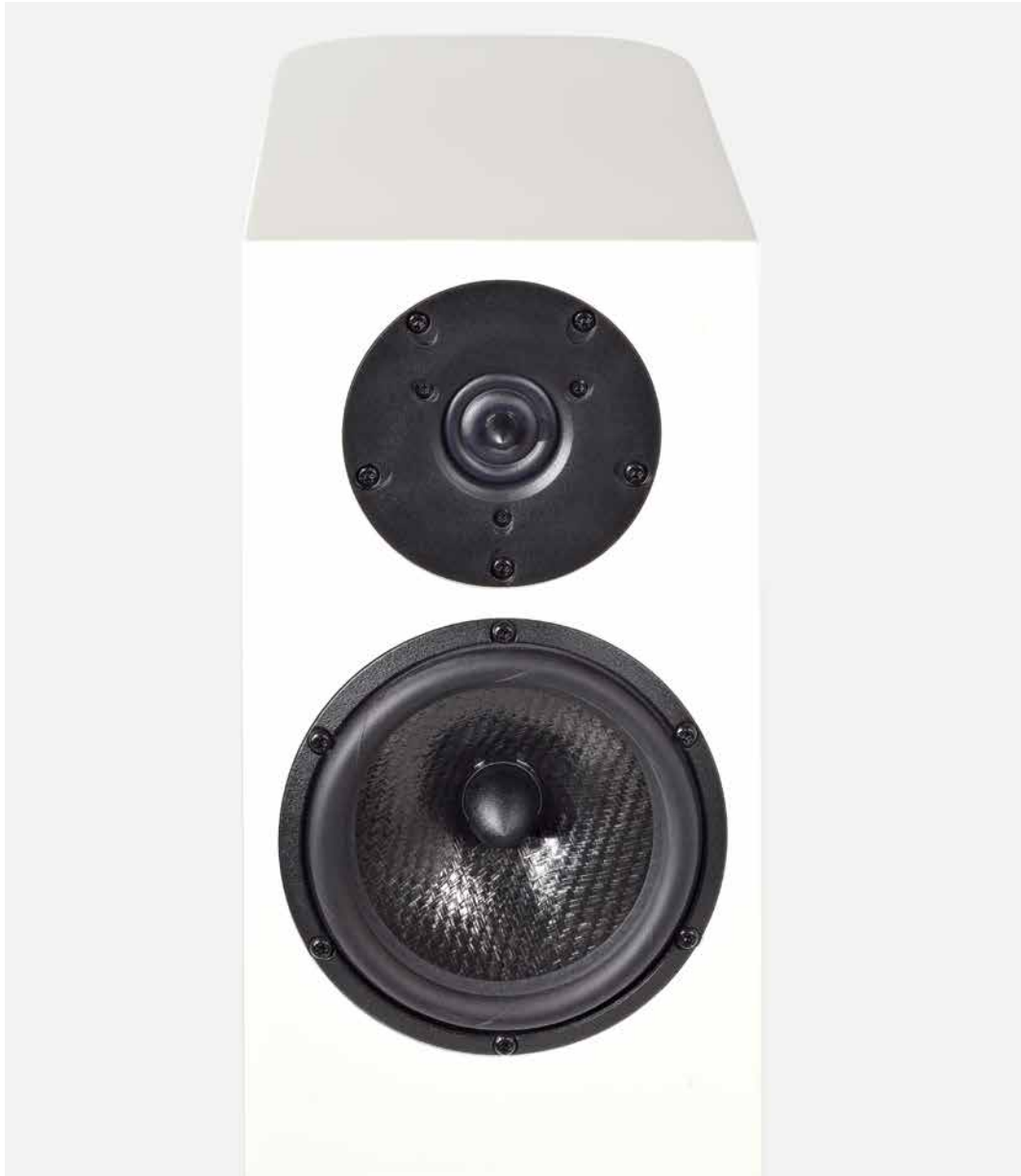
Als Tiefmitteltöner setzten die Franzosen ein 16-Zentimeter-Chassis ein, dessen Isostatic-Matrix-Membran aus „Polypropylenfäden“ besteht, die miteinander verwoben werden. Beim Tweeter handelt es sich um einen 25-Millimeter-Ringradiator (1 Zoll), der ab 3,8 Kilohertz übernimmt.